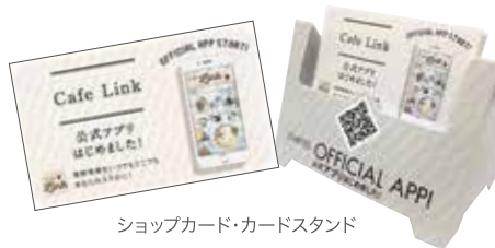
ショップカード・カードスタンド